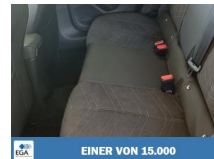
EINER VON 15.000