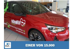
EINER VON 15.000