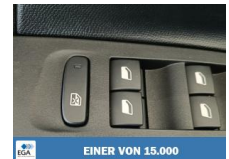
EINER VON 15.000