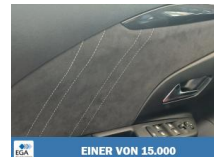
EINER VON 15.000