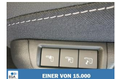
EINER VON 15.000