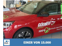
EINER VON 15.000