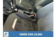
EINER VON 15.000