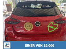
EINER VON 15.000